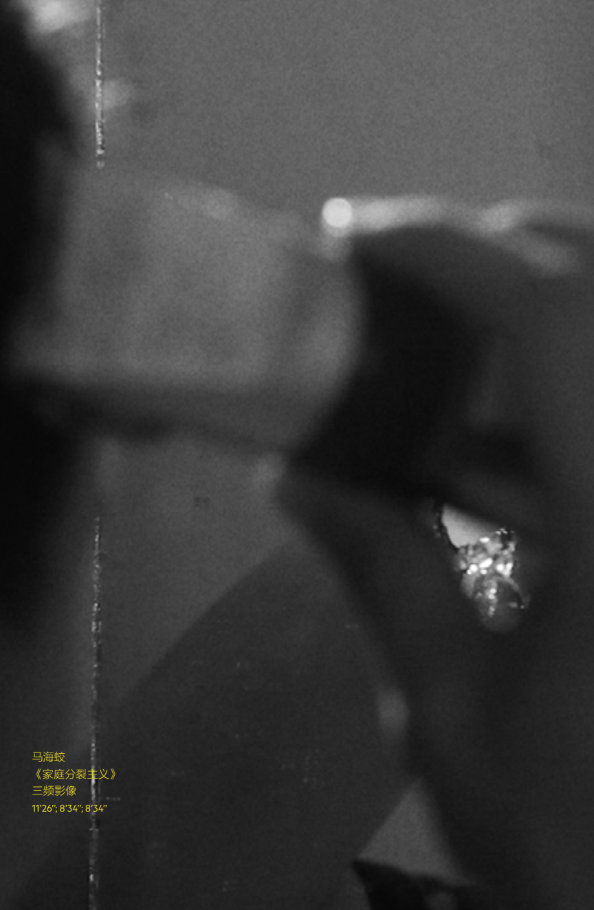
马海蛟 《家庭分裂主义》 三频影像 11'26"; 8'34"; 8'34"