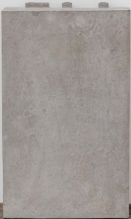
张如怡 《比重》 2016 混凝土、铁 29 x 13.2 x 47.8 cm