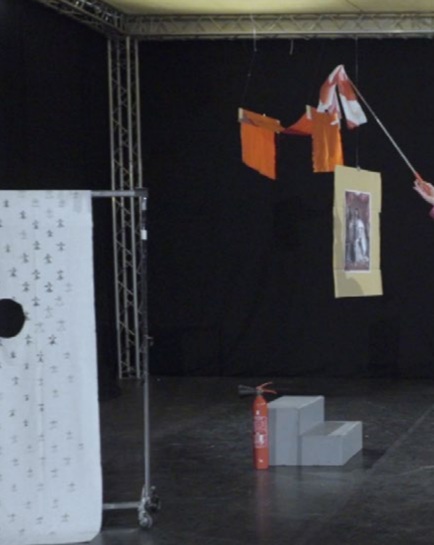
姚清妹 《光谱：夜之皇室芭蕾 II》 2017 影像 8'10"