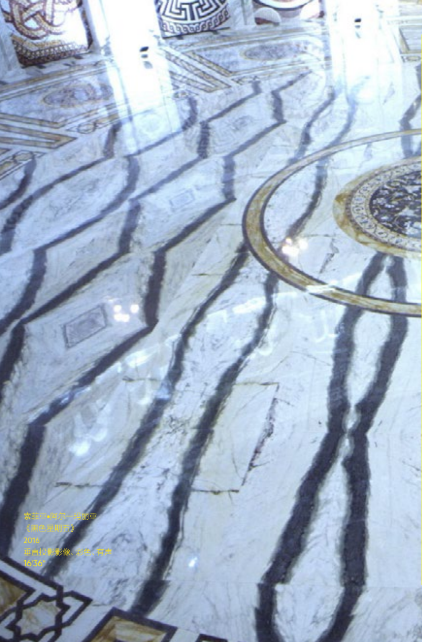
索菲亚·阿尔—玛丽亚 (《黑色星期五》) 2016 垂直投影影像、影像、投影 16:36'