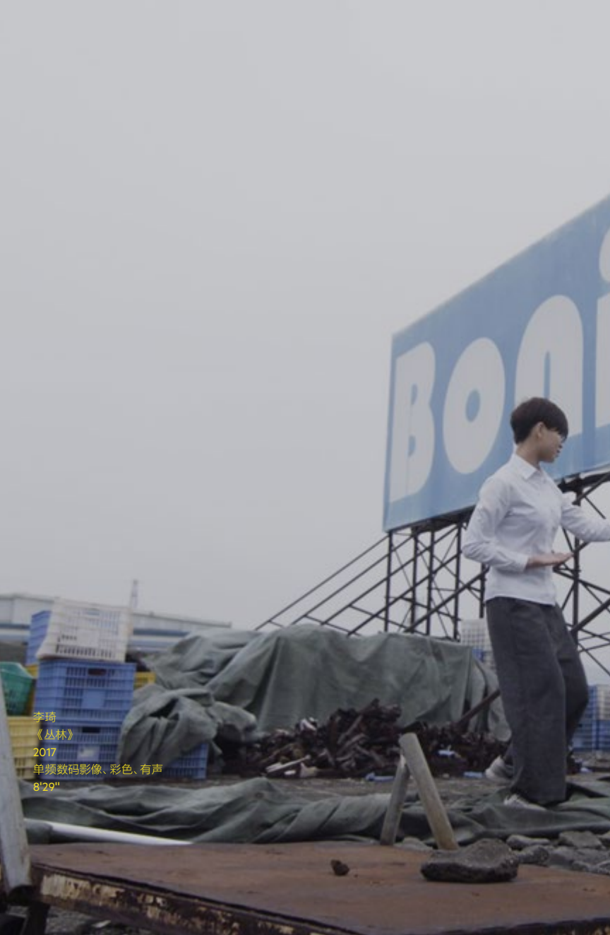
李琦 《丛林》 2017 单频数码影像、彩色、有声 8'29"