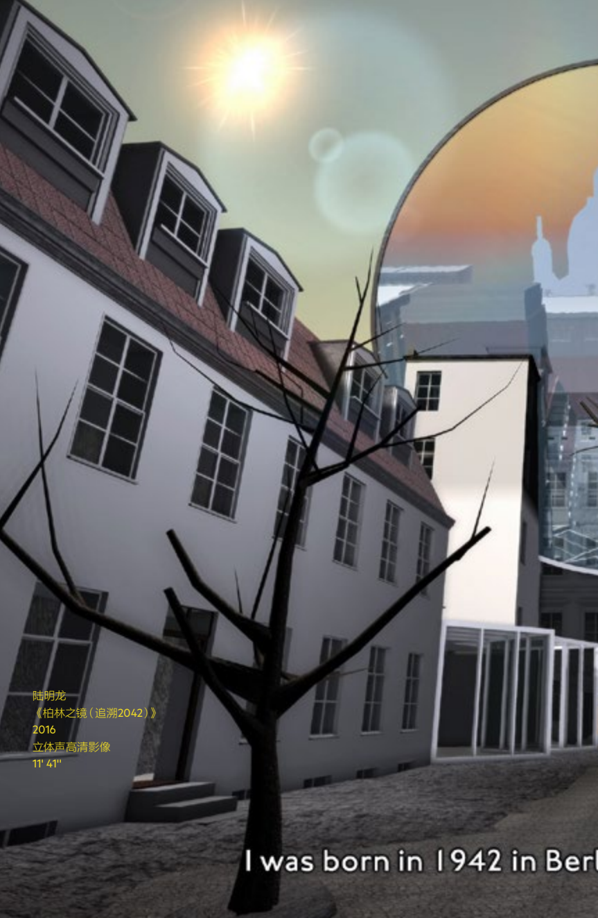
陆明龙 《柏林之镜(追溯2042)》 2016 立体声高清影像 11' 41"