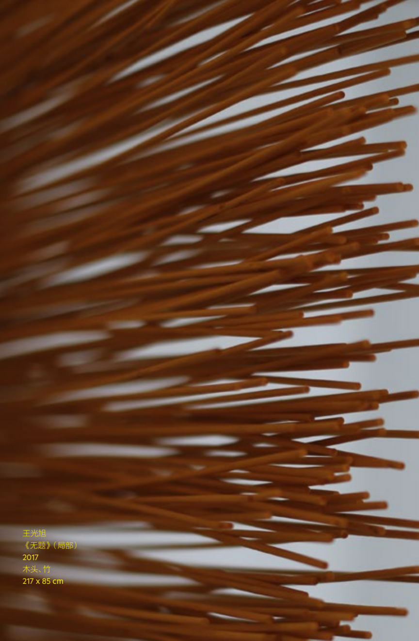
王光旭 《无题》(局部) 2017 木头、竹 217 x 85 cm