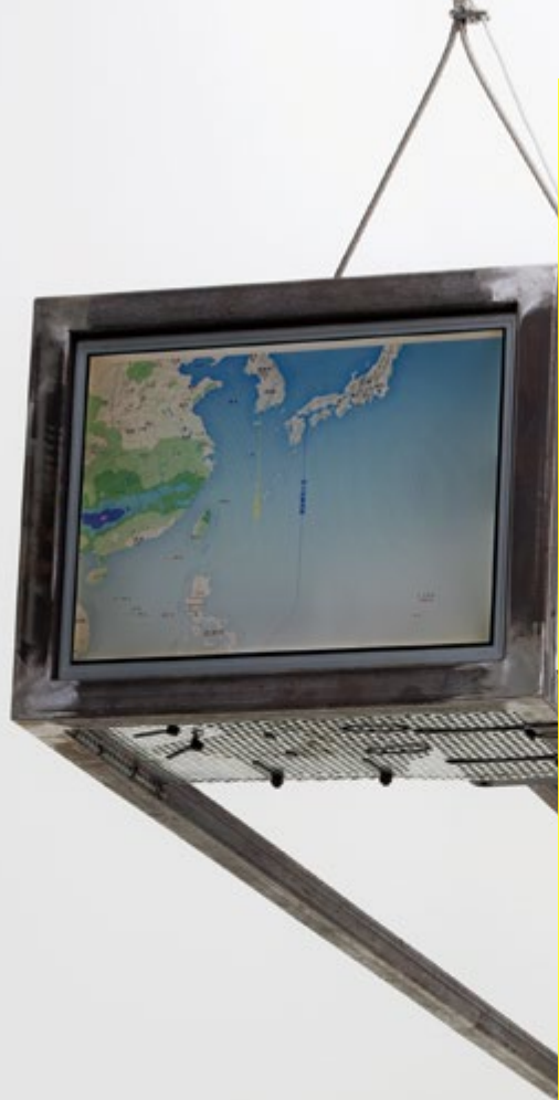
廖斐 《一件地球雕塑》 2015 两套电脑显示器、主机、钢架结构 250 x 38.5 x 31.5 cm