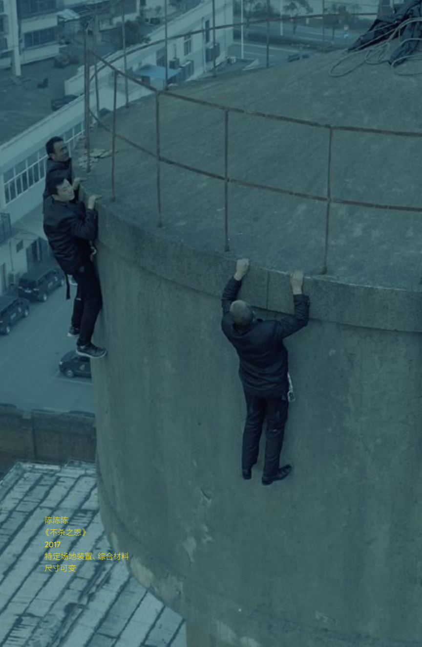
陈陈陈 《不杀之恩》 2017 特定场地装置、综合材料 尺寸可变