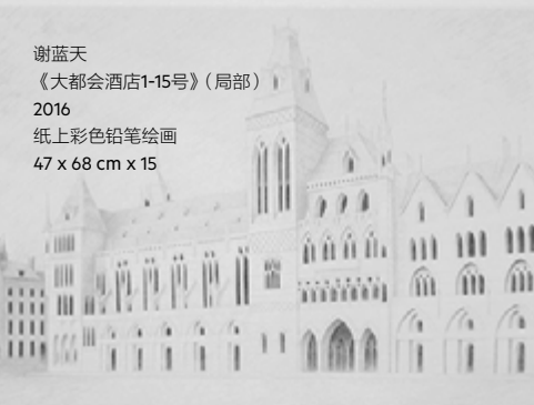
谢蓝天 《大都会酒店1-15号》(局部) 2016 纸上彩色铅笔绘画 47 x 68 cm x 15

谢蓝天的纸上彩色绘画作品系列《大都会酒店1-15号》再现了分布于全球各地，而俱以“大都会”为名的酒店素描。这些酒店存在于现代不同时期的纽约、迪拜、华盛顿特区、开罗、巴塞罗那、悉尼等城市，有些建于19世纪，有些建于20世纪后半叶，亦包括一座计划建在伦敦而最终烂尾的酒店。这些建筑的风格、造型各异，有些仍在运营，有些业已停业。这些临摹而得的铅笔画反映了“大都会”这一符号在全球范围以酒店为形式的蔓延，由此彰显出现代性与全球化的发展。