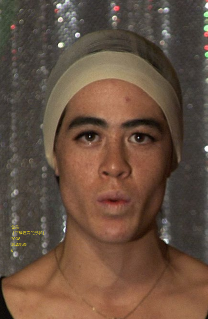
曾吴 《正确宣言的形状》 2008 高清影像 5'