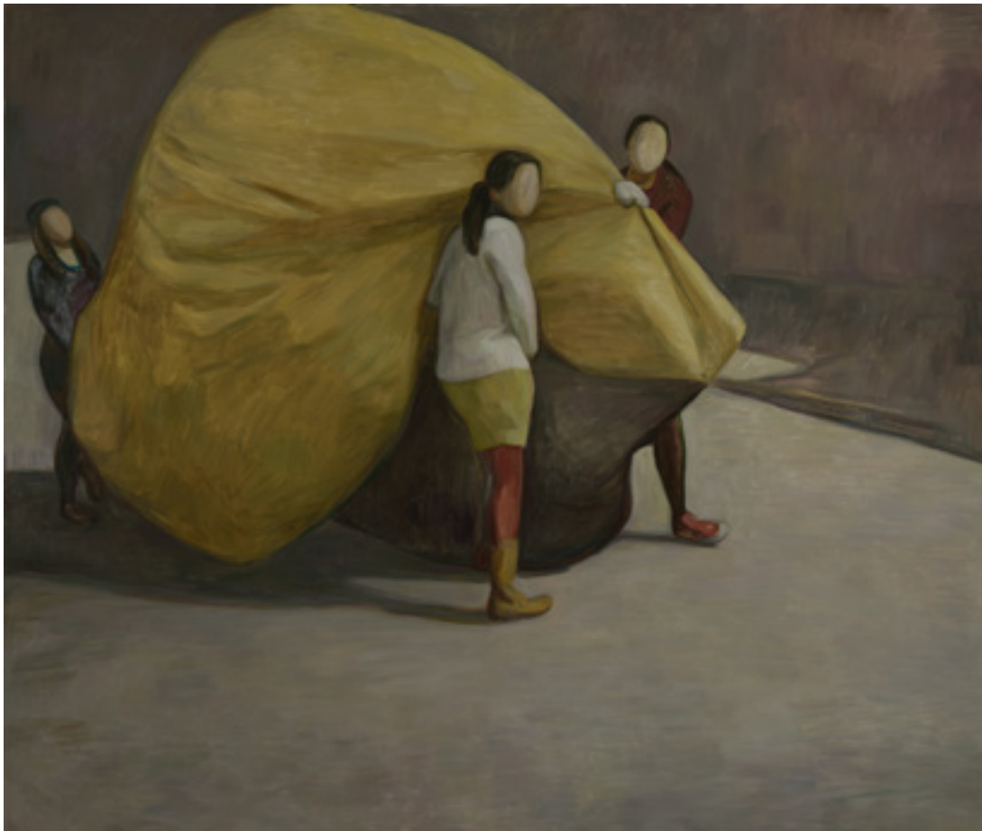
▲ 《无题》 2015 布面油画 260 x 280 cm

遭历史事件的游离态度。唯有作品标题提示着事件的地理坐标，如《东北》《西北》。这种“去语境化”的反思形式将现实本身分解并升华为某种美学立场，或许可作为抵达另一重真相的途径。