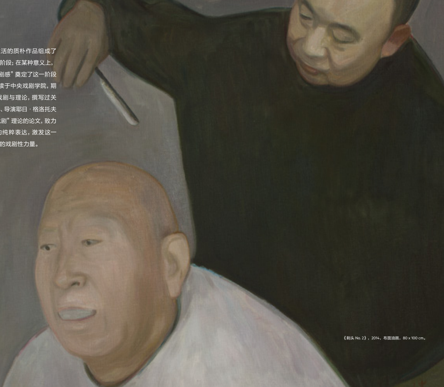
《剃头 No. 2》，2014，布面油画，80 x 100 cm。

一系列反映日常生活的质朴作品组成了“旅程”的“还乡”阶段；在某种意义上，王音作品中的“戏剧感”奠定了这一阶段的基调。王音曾就读于中央戏剧学院，期间大量接触先锋戏剧与理论，撰写过关于波兰先锋剧作家、导演耶日·格洛托夫斯基及其“质朴戏剧”理论的论文，致力于探究油画媒介的纯粹表达，激发这一媒介直面观众之时的戏剧性力量。