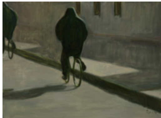
▼ 《西北（午后）》 2015 布面油画 60 x 80 cm