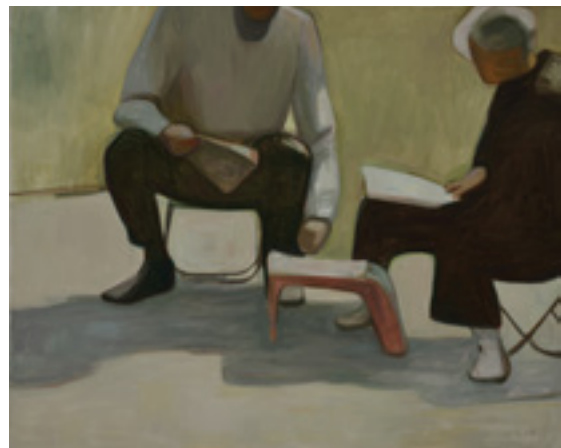
◀ 《无题（修鞋）No. 4》 2015 布面油画 165 x 200 cm

王音有意祛除了画面的雕琢感，甚至隐匿了绘画知识的痕迹，一切都只呈现为一种“普通”经验；画面的节制使作品获得了