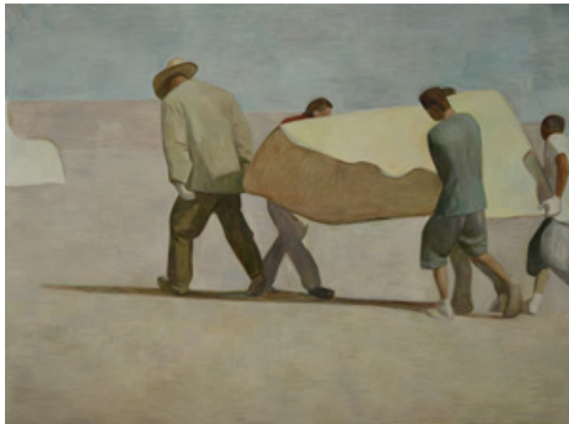
《西北》，2015，布面油画，300 x 400 cm。

《东北》《西北》为王音的近作，艺术家以更大的尺幅作画，人物形象却更加概括，置身边疆旷野，呈现出更强烈的疏离感。空旷背景中的劳动者皆缺失面孔，集