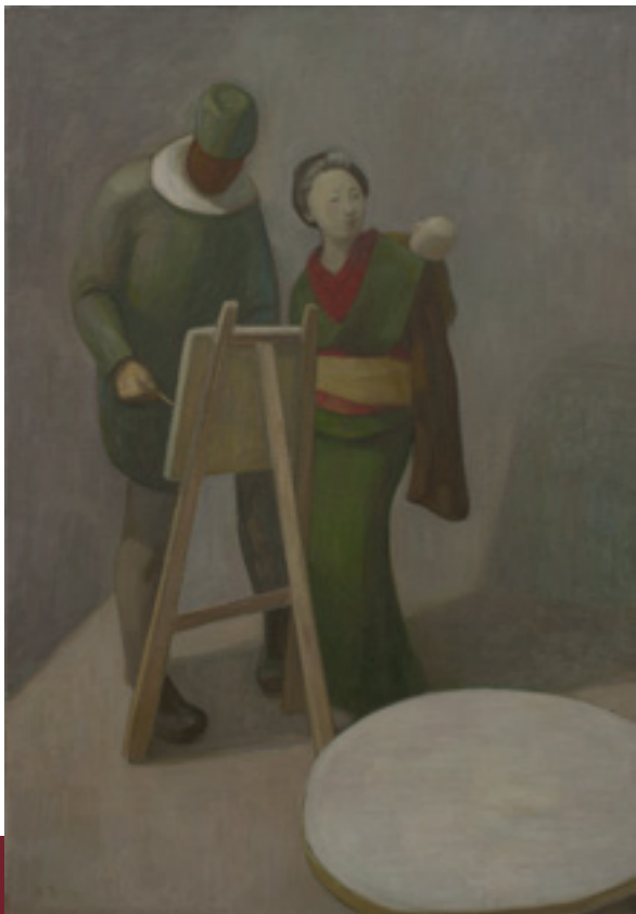
◀ 《画家 No. 2》 2014 布面油画 180 x 125 cm

《赤脚画家》中，王音展现了画家创作的场景，对最能体现画家身份的脸、手做了模糊化处理，画架和前方摆放芒果的静物台提示画家正在这一绘画的空间内部努