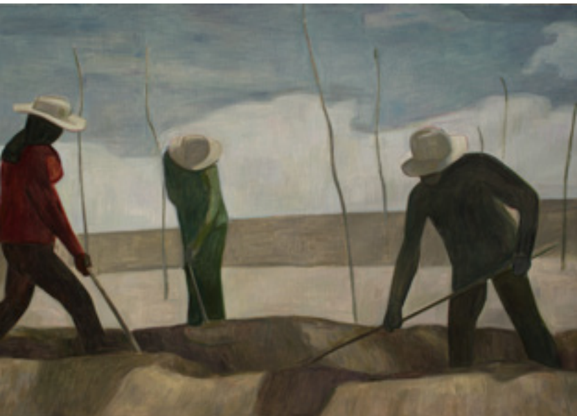
《东北》，2015，布面油画，200 x 285 cm。