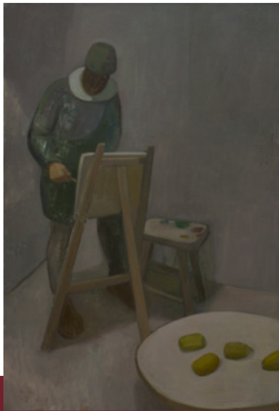
◀ 《赤脚画家》 2013 布面油画 155 x 105 cm

力制作另一重图像。标题中的“赤脚”一词与“芒果”象征着文革时期大批“上山下乡”的年轻艺术家既缺乏艺术教育，又面临意识形态说教的处境。《画家 No. 2》