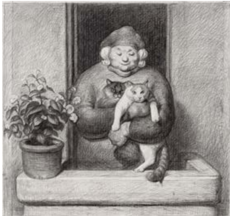
▲ 王兴伟，《老太太抱猫》，铜板，66.5 X 69.5厘米。

尤伦斯限量版艺术品和王兴伟共同推出限量版“老太太”系列版画，于UCCA展览“王兴伟”同期在尤伦斯艺术品店/书店上架。其中，铜版印刷《老太太抱猫》共发布15版。展览开幕后，此系列将赴2013首届香港巴塞爾艺术展与观众见面。